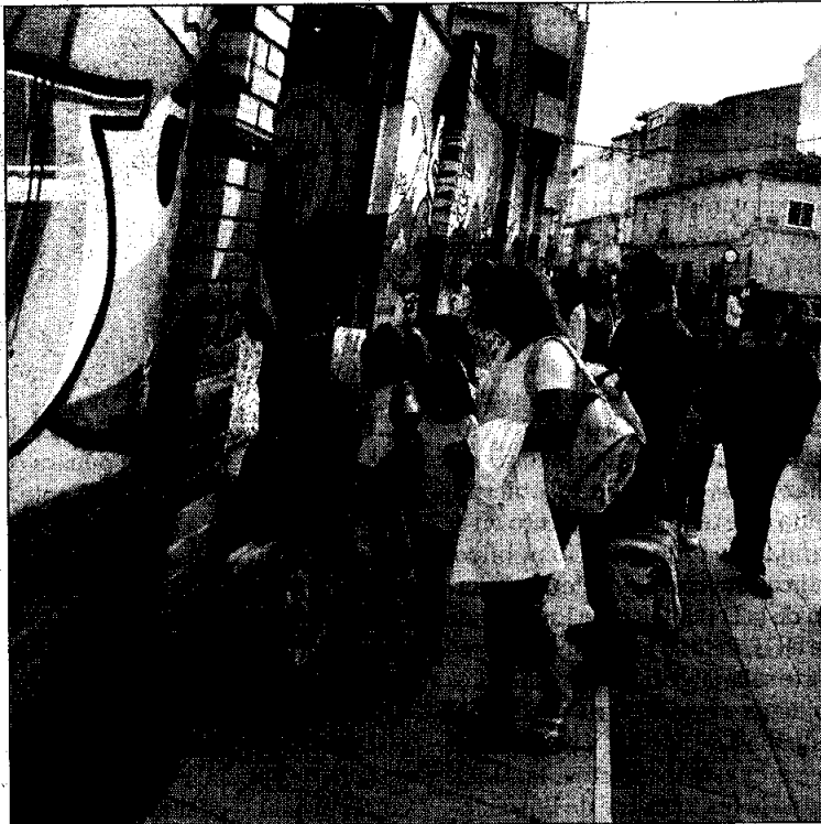
Acceso a uno de los centros escolares de la capital.

Habilitar itinerarios seguros implica algunos cambios. «El primero, espectacular, es que los niños van al cole andando, en patinete o en bicicleta, y con sus amigos», subrayó Majado, que añadió que «se han ido generando de ma-