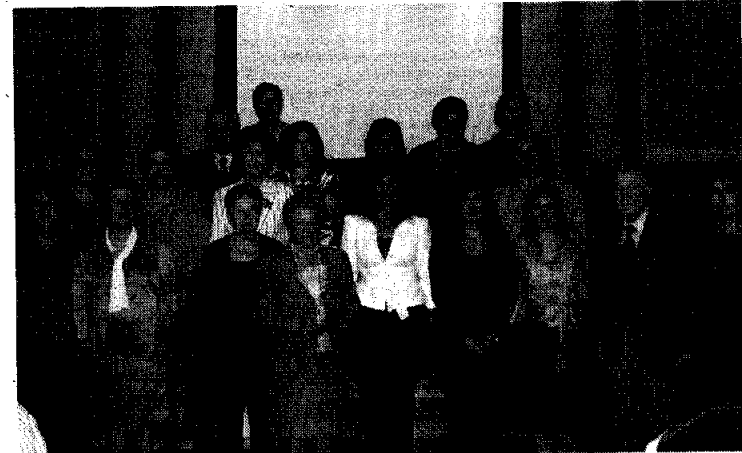
El acto de clausura del curso 2009/2010 se celebró en el Instituto Bachiller Sabuco.

Como colofón final al acto, el Coro de la Asociación de Alumnos de la Universidad de la Experiencia (ALUEX) actuó ante todos los presentes.