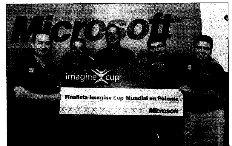
Equipo que representará a España en la final internacional.

El proyecto Imahe representará a España en la final internacio-